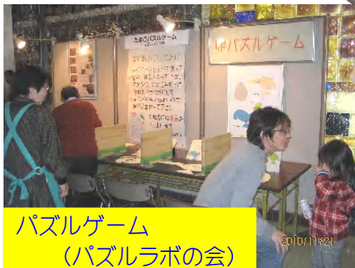
パズルゲーム (パズルラボの会)