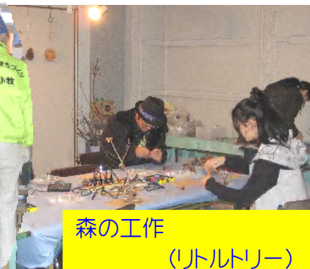
森の工作 (リトルトリー)