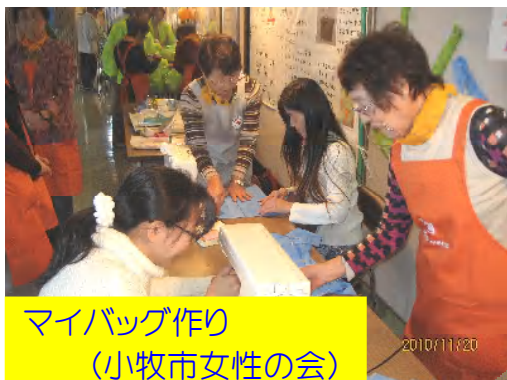
マイバッグ作り (小牧市女性の会)

屋内イベントでは、環境問題で活躍している市民団体の皆さんによる、楽しい体験型のブースが多数出展されました。マイバッグ作り、菜種油搾り体験、「白玉星草」や珍しい「天魚」の展示、森の工作、そのほか「たまごパズル」、ごみ減量化を目指して「ごみの分別ゲーム」等、環境に即した体験、展示がされました。