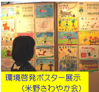
環境啓発ポスター展示 (米野さわやか会)