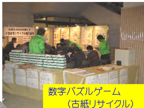
数字パズルゲーム (古紙リサイクル)