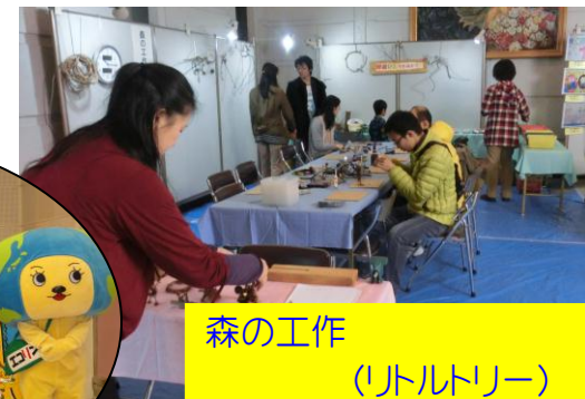
森の工作 (リトルトリー)