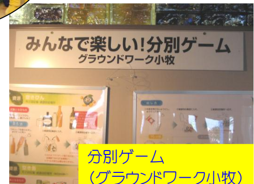
分別ゲーム (グラウンドワーク小牧)

イベントが終わり、最後に会場周辺のごみ拾いを行いました。市民の皆さんの意識は年々向上しておりポイ捨ても減っていました。