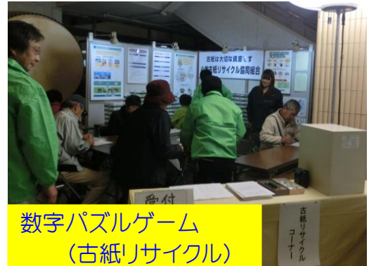
数字パズルゲーム (古紙リサイクル)