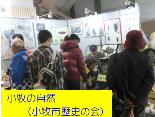
小牧の自然 (小牧市歴史の会)

屋内では、環境づくりで活躍している市民活動団体の皆さんによる、楽しい体験型のブースが多数出展されました。マイバッグ作り、菜種油しぼり体験、貴重な「白玉星草」の展示、森の工作、そのほか「たまごパズル」、ごみ減量化を目指して「ごみの分別ゲーム」等、環境都市づくりをめざした体験、展示がされました。日曜日は菜の花畑で好評だった恐竜を使い写真撮影コーナーを設置し、110名を超える皆さんが、撮影した写真をケースに入れて、うれしそうに持ち帰りました。