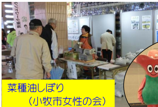
菜種油しぼり (小牧市女性の会)