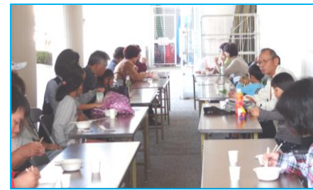
にこにこニコラの美味しいぜんざいはいかが！

小牧市女性の会は、菜種油搾り、マイバッグ作りの体験コーナー、そしてにこにこニコラの店ではおいしいぜんざいと無農薬のサツマイモスティック。