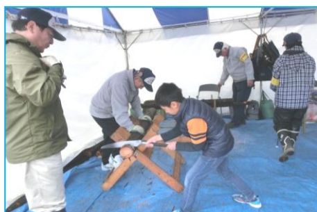
稚児の森活動グループで丸太切りに挑戦しコースター作り！！

稚児の森活動グループでは、間伐材の有効利用の一環として丸太切り体験、葉っぱのラミネート作り等、いろいろな利用方法をしています。