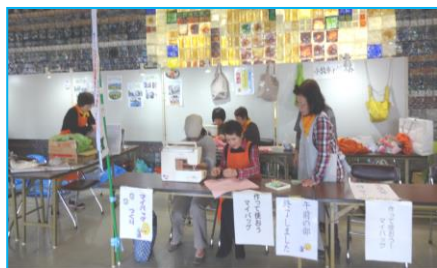
小牧市女性の会でマイバッグコーナー！！

小牧市女性の会は、菜種油搾り、マイバッグ作りの体験コーナー、そしてにこにこニコラの店ではおいしいぜんざいと無農薬のサツマイモスティック。