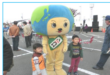
小牧市環境キャラクターエコリンも会場で！！

稚児の森活動グループでは、間伐材の有効利用の一環として丸太切り体験、葉っぱのラミネート作り等、いろいろな利用方法をしています。