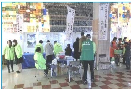
グランドワーク「ごみ分別ゲーム」！！

環境フェアでは「環境にやさしいライフスタイルをご提案！」をテーマに、日頃から環境にやさしい小牧市を目指して活躍する市民活動団体の皆さんが工夫を凝らした体験型のブースを中心に屋内・屋外で展開されました。多くの市民でにぎわい環境に対する興味を持っていただきました。